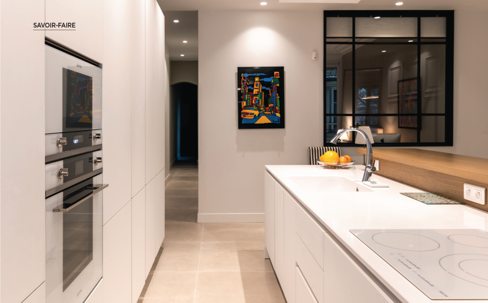
Reposant sur une « boîte », le plan snack permet de dissimuler partiellement l'évier et d'y intégrer des prises pour les robots.